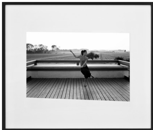
Spleen #2, Franz interpreted by Alessio, 2010