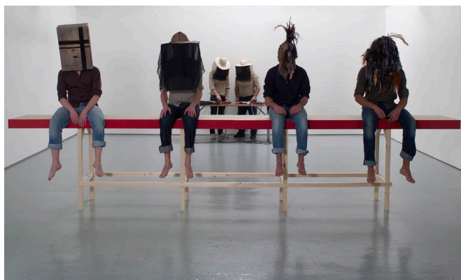
Chariot, Fool, Emperor, Force , 2009 Projection vidéo, son, banc en bois