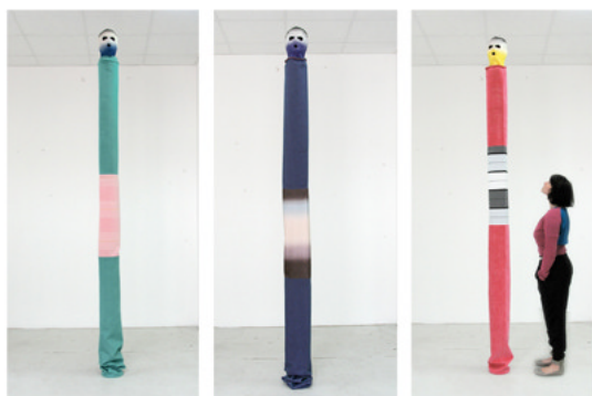
Three Wise Monkeys , 2010