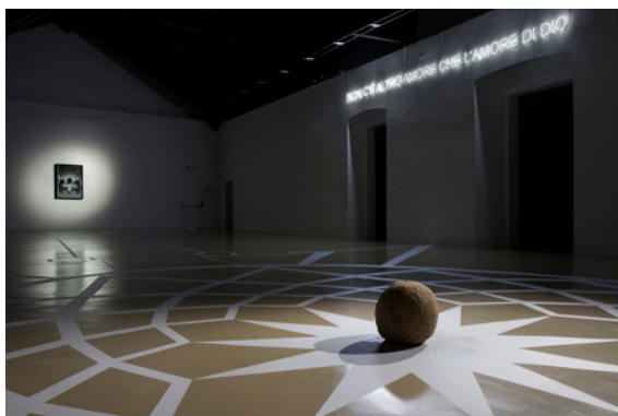
Myrrhina, 2008 Vue d'installation "T2, Triennale Torino" Pietro Roccasalva and ZERO..., Milan