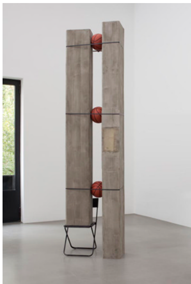
Untitled (Jumping Jack), 2009 75 x 330 x 40 cm Installation à Portikus, Francfort