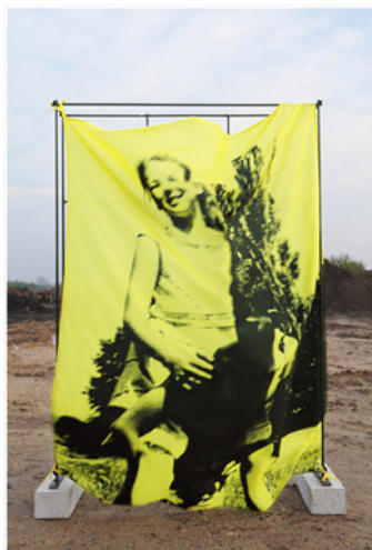
Sans titre , 2009 Impression digitale