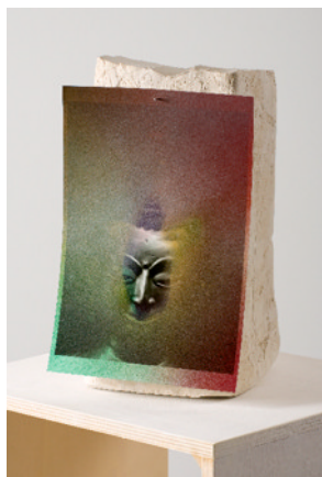
Untitled, 2010.