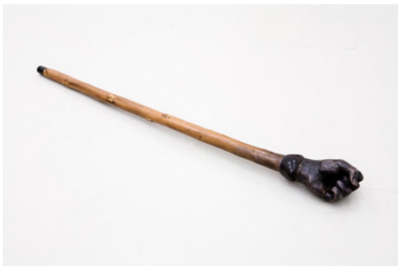
Bastone , 2009 Bronze, wood, bone/ 90 X 9 X 8 cm