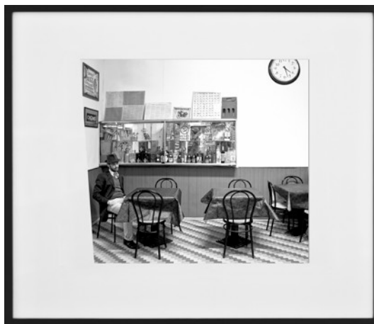
Spleen #1, Nana interpreted by Silvia, 2010 Courtoisie Studio Guenzani, Milan Courtoisie de l'artiste